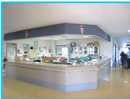
サービスステーション